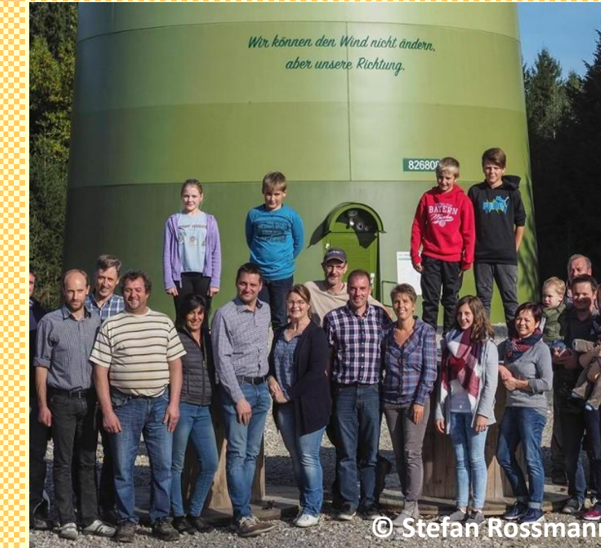
Osterkling GmbH, Betreiber des Windrads in der Gemeinde Bruck, Landkreis Ebersberg