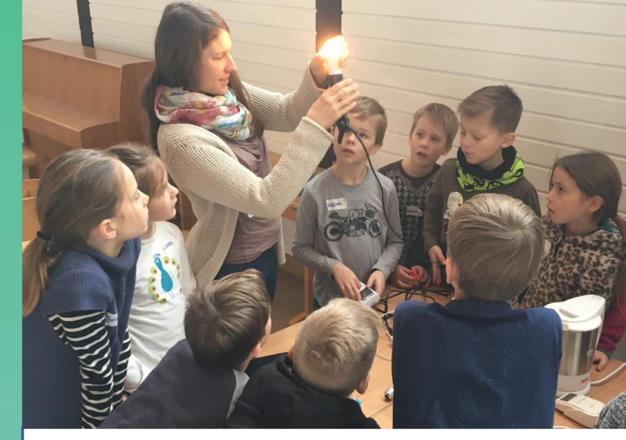
Für Schulen & Schüler